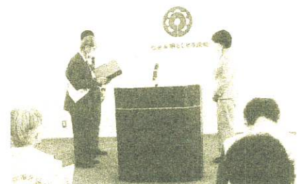
副市長への伝達の様子

終了後、会員たちが各小学校を訪問し、子どもたちに広報用のポケットティッシュを配りました。